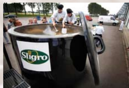
's werelds grootste mosselpan